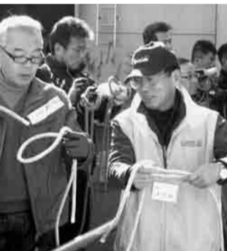
地域住民に防災知識や技術を教える防災士

自分のできる地域貢献として防災士の資格を取りました。防災知識や災害への予防方法の啓発に取り組んでいます。これからは若い人にも資格を取ってほしいですね。