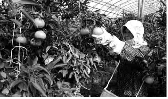
心を込めて収穫する生産者

2〜3月が旬のせとかは、かんきつ史上最高の芳香といわれる香りやトロリとろける食感、濃厚でジューシーな味わいで「みかんの大口」と称されます。まつやま農林水産物ブランドに認定されています。