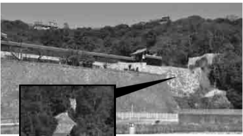
堀之内から見える「登り石垣」

県庁裏登城道から山頂へ連なる「登り石垣」。全国でも他に彦根城(滋賀県)と洲本城(兵庫県)にしかなく、中でも松山城の登り石垣は最大の規模です。