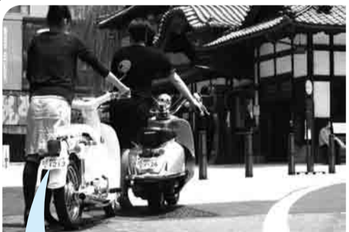
かわいい形の「雲型ナンバープレート」

ご当地ナンバープレートの先駆けで今は見慣れた原動機付自転車の「雲型ナンバープレート」は、平成19年に本市が全国で初めて導入しました。 形の由来は、本市が進める『坂の上の雲』のまちづくりにちなんでいいます。また、この時に「松山市」の表記が、「道後・松山市」に変わりました。