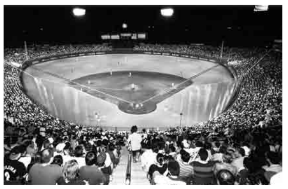
2002年坊っちゃんスタジアムでのオールスターゲーム

夢の球宴と呼ばれる「プロ野球オールスターゲーム」。 本年7月21日に坊っちゃんスタジアムで開催されますが、2002年にも同スタジアムで開催されており、地方球場で2回目の開催となるのは全国で初めてです。 その誇りを胸に、松山から全国に元気を届けていきます。