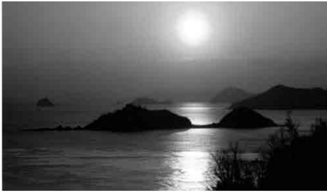
多美島、水軍口マン。世界が認める瀬戸内海の夕焼け

青い海、緑の島、白い砂浜の「瀬戸内海」は、私たちがいつもながめる穏やかな海です。この瀬戸内海は、昭和9年、全国で初めて雲仙や霧島とともに国立公園に指定されました。陸域・海域を含めると、日本一広大な国立公園です。 これに先駆けること明治元年、瀬戸内海を訪れたドイツの地理学者リヒトホーフエン(シルクロードの命名者)は「こんな広大で優美な景色は世界のどこにもないであろう。いずれこの景色は世界の人に紹介をされ、称賛されるであろう」と言葉を残し、近代ツーリズムの祖といわれるトーマス・クックやシーボルトも瀬戸内海の景観を絶賛しました。