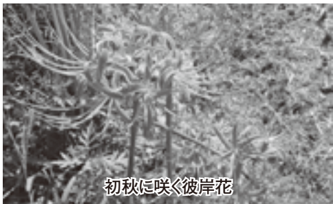
初秋に咲く彼岸花

み取り大会など、豊かな自然を生かした教育や体験学習に力を入れています。地区には、恵まれた自然の中で育まれた文化が受け継がれています。毎年お盆には650年前この地を治めた武将の霊を慰め、川への感謝や五穀豊穡に感謝する「川施餓鬼」が行われ、石手川の中で約12メートルの大幟4本を担ぎ倒れないよう上流まで練り歩きます。同じく福見川町徳正寺では、城主とその一族の慰霊のため400年間踊り継がれる県無形文化財