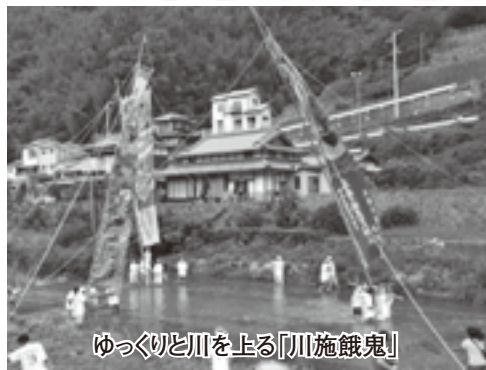
ゆっくりと川を上る「川施餓鬼」

日浦地区は、人口364人、世帯数171世帯(11月1日現在)。清流と緑に囲まれ、中心部には保育園や小中学校、生活改善センターなどが隣接し、地域で取り組むホタルの里づくりや魚のつか