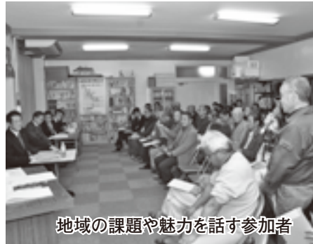
地域の課題や魅力を話す参加者

の「提婆踊り」が披露されます。また当地区は彼岸花の名所でも知られ、公民館主催の彼岸花写真コンテストは今年で14年目。毎年、彼岸花の季節には多くの人が訪れ、のどかな山村を彩る赤の帯を楽しんでいます。