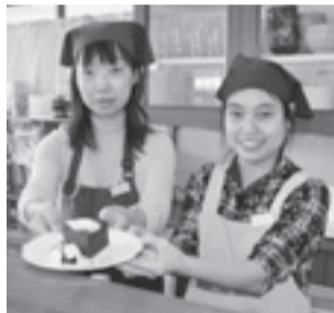
人気のガトーショコラを食べに来てくださいと話す利用者

一緒に働き、活動し合える社会を さらりの森には喫茶店があり、利用者自らが接客をしています。ぜひ多くの人に障がいがある人も、きちんと働ける姿を見てほしいです。ただ多くの人に来てもらうだけで