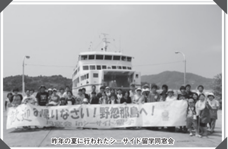
昨年の夏に行われたシーサイド留学同窓会