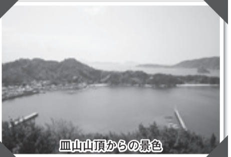
皿山山頂からの景色

また野忽那島は、平成15年に公開された映画「船を降りたら彼女の島」の舞台になっていて、スクリーンの中に島の美しい風景がたくさん描かれているんだよ。映画の中では「瀬ノ島」と呼ばれていて、中でも、主人公・久里子の生家があったとされている皿山山頂からの景色は、美しい瀬