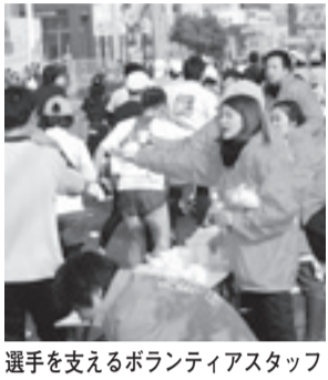
選手を支えるボランティアスタッフ

【日時・内容】平成24年2月4日(土)9時～20時II大会前日の活動(参加者受け付けなど)、2月5日(日)6時～18時II大会当日の活動(ランナー用駐車場での誘導・コース設営・交通規制補助・給水・給食など) 【対象】平成24年1月に開催のボランティア事前説明会に参加できる、健康で元気な人(中学生以下は保護者同伴) 【定員】2000人程度(先着順) ※スタッフジャンパーと弁当が支給されます。事前説明会と大会当日の交通費は自己負担 【申し込み】11月30日(水)必着までに、郵送またはファ