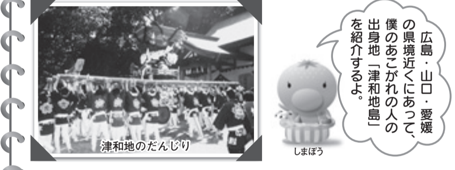
津和地のだんじり