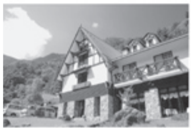
連絡先：森の国ホテル 0895-43-0331 ホームページ： http://www.morinokunihotel.com/

○森の国ホテル20周年 足摺宇和海国立公園滑床溪谷にある『森の国ホテル』は今年で20周年を迎えます。森の国ホテルは平成3年に山岳リゾート風プチホテルとしてオープンしました。近くには自然豊かな滑床溪谷があります。くつろぎのホテルとしてふさわしい様相で、皆様のお越しをお待ちしております。