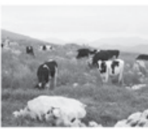
四国カルスト大野ヶ原【西予市】 日本三大カルストの一つで、四季折々の風景が心を癒します。

○観音水そらめん流し 名水百選選定の観音水で毎年恒例となっているそらめん流し。暑い季節を観音水のひんやりとした空気とともに癒します。 回 4月29日(金・祝)〜9月10日(土)10時〜17時 西予市宇和町明間・観音水 大人600円 小学生300円 幼児200円 西予市商工観光課 0894-6216408