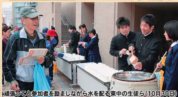
頑張ると参加者を励ましながら水を配る東中の生徒ら(10月30日)