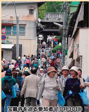
宝厳寺を巡る参加者(10月30日)