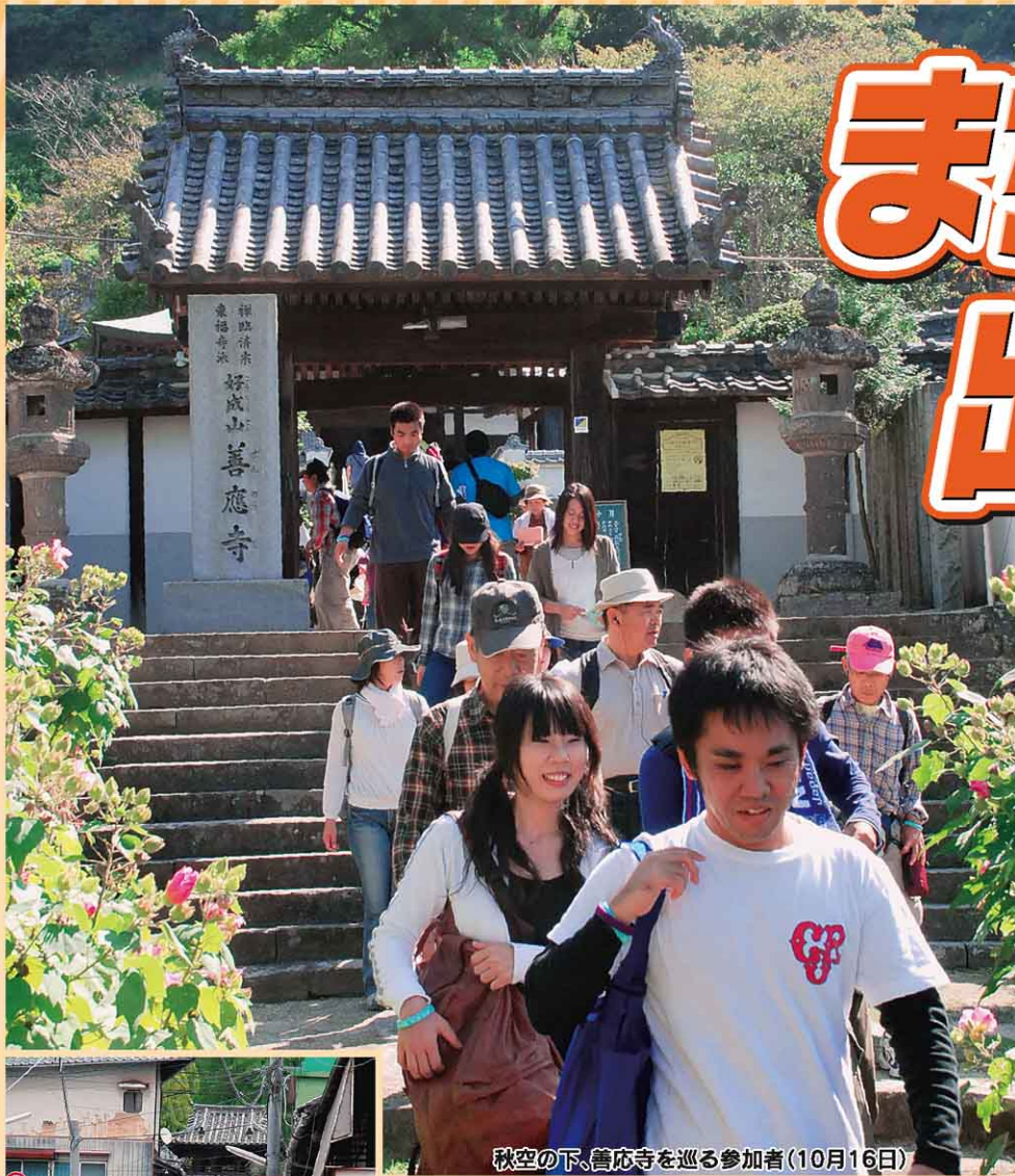
秋空の下、善応寺を巡る参加者(10月16日)

16日は、河野氏発祥の地で古名、風早と呼ばれた北条地域を歩く「風早ウォーク」。北条文化の森公園をスタートし、河野氏の菩提寺・善応寺を巡る約7kmのコースと、鹿島、国津比古命神社も巡る約14kmのコースに、約800人が参加しました。 30日に実施の「お城下ウォーク」には、約2000人が参加して、南北朝時代に河野通盛が風早から本拠を移した湯築城址や宝厳寺など、約8kmのコースを巡りました。 参加者はコース途中で設けられたポイントでクイズラリーにも挑戦。思い思いに、河野氏ゆかりの史跡や文化に触れながら、斎灘の潮騒や松山城下の町並みなどを楽しみました。