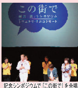
記念シンポジウムで「この街で」を合唱 (このシンポジウムは全国モーターボート競走施行者協議会からの拠出金を受けて実施したものです)