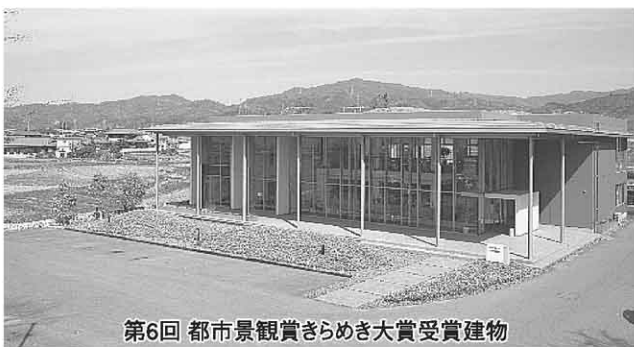
第6回 都市景観賞さらめき大賞受賞建物