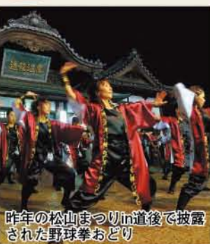
昨年の松山まつりin道後で披露された野球拳おどり

「道後温泉夏まつり」が8月1日~31日まで、道後温泉本館周辺で開催されます。 ■オープニングイベント「道後村まつり」 1日(日) 9時30分~湯釜葉師祭、19時~オープニング、マドンナ任命式 2日(月) 19時~本家野球拳大会 1日(日)・2日(月) 13時~限界に挑戦!スポーツテスト・道後ハイカラ通りクイズゲーム・足ツボマッサージ、14時~人力車体験、18時~