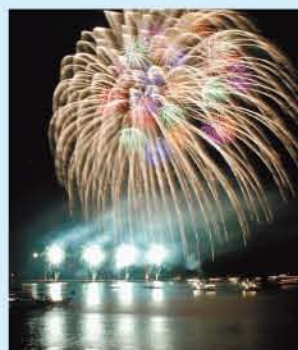
今夏の花火は、会場沖合300mの台船から打ち上げ予定。迫力ある花火が間近で楽しめます。

【開催日】7月24日(土) 予備日 7月25日(日) 【内容】夜店コーナー 16時~(北条港外港荷揚げ場) 花火打ち上げ 20時30分~21時20分(予定)