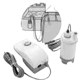
家庭用バスポンプ

【補助額】5000円 ③シングルレバー式湯水混合水栓(同じハンドルでお湯と水が出る)に改造 【補助額】3000円 【対象】1世帯1回限り(①②はどちらかのみ)で、購入・改造日および申請時に本市に住民登録があり次の条件を満たす人 ①②市内販売店から購入