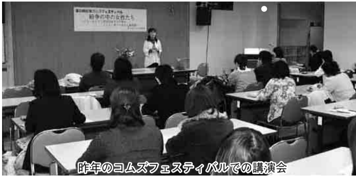
講演【時間】13時30分～14時30分(開場13時)