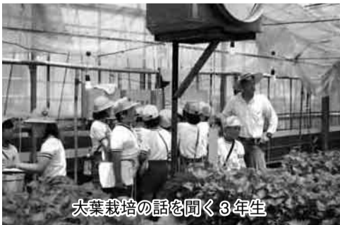
大葉栽培の話聞く3年生