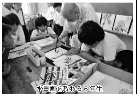
水墨画を教わる6年生

（3年生女子） ぼくは墨絵体験で、お手本のようにうまく描けるか心配だったけど、墨絵の先生に描き方など分かりやすく教わり、何回も描くうちにできるようになりました。6年生男子