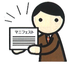
④マニフェストの管理 3ページ