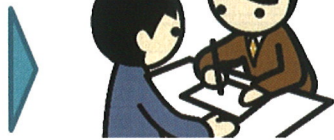
②処理業者との契約 2ページ