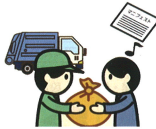
③ごみの保管と引渡し 3ページ