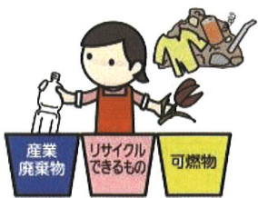
①適正な分別 2ページ

事業系ごみを適正に処理するために必要な情報について、 ④マニフェストの管理 まで説明していきます。