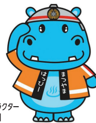
松山市消防局マスコットキャラクター 「はっぴーカバー君」

違反対象物の公表制度とは、安心して建物を利用していただくために、重大な消防法令違反のある建物を松山市ホームページで確認できる制度です。