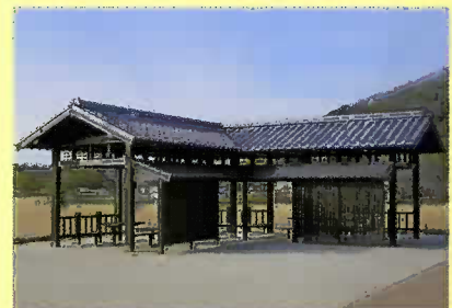
▲休憩所(やすらぎ広場東側)