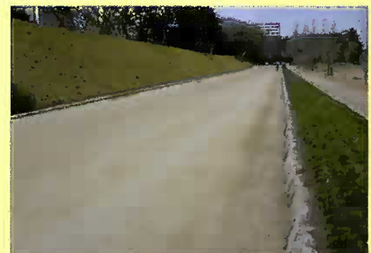
▲馬場(ふれあい広場西側)