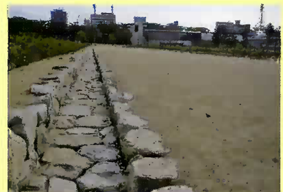
▲石組み側溝(江戸時代の様子を再現)