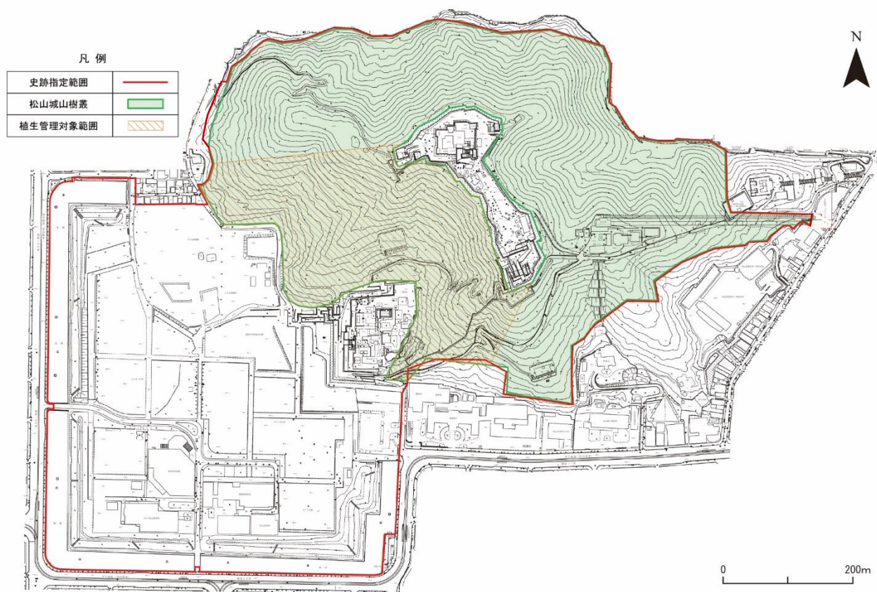
図60 眺望確保のための植生管理計画図