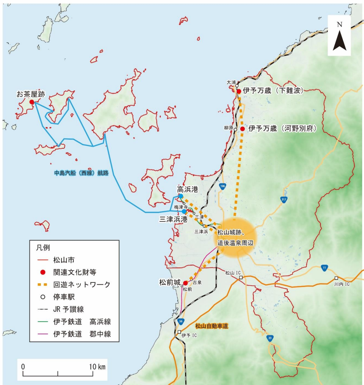
図 61 回遊ネットワーク例図