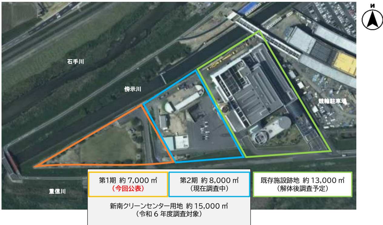
土壤汚染調査計画図