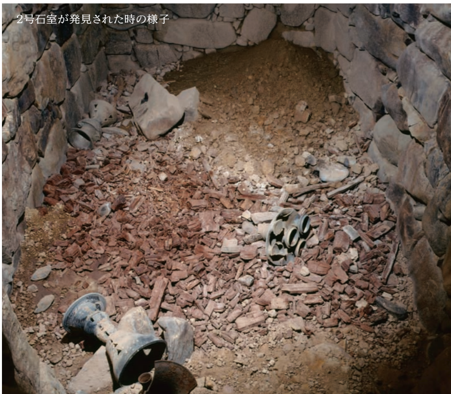
2号石室が発見された時の様子