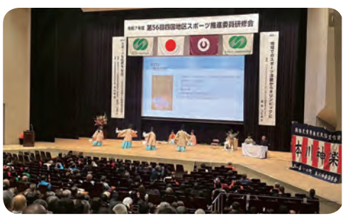
次は群馬大会です。みなさんの参加、お待ちしております！

お話しをしていただきました。その後、国指定重要無形民俗文化財「土佐の神楽」の演舞が行われました。 2日目の分科会では、徳島県吉野川市スポーツ推進委員会の取組で「つなぐ・ひろげる・ふかめる」活動についての発表がありました。最後には質問がたくさん出て、有意義な意見交換が交わされました。