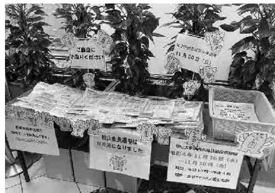
(オ) 選挙CM (市駅前コンコース・まつちかタウン)