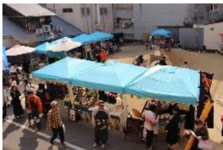
●マルシェ開催の様子

みんなのひろばでは計 83 件（月平均約 2 件）のイベントが実施され、延べ利用者数は約 22.8 万人（月平均約 4,900 人）であった。もぶるテラスでは計 865 件（月平均約 18 件）のイベントを実施し、延べ利用者数約 9.1 万人（月平均約 1,800 人）であった。開催されたイベントのうち、一般の個人・団体の開催率は、ひろばで約 4 割、テラスで約 6 割であった。中央商店街をはじめ、様々な主体と連携しながら、みんなのひろばでは、マルシェや音楽ライブ、フリーマーケット等が実施され、もぶるテラスでは、商店街を回るスタンプラリーの実施や絵本の読み聞かせ、各種ワークショップ・講座等、多様なイベントが展開された。