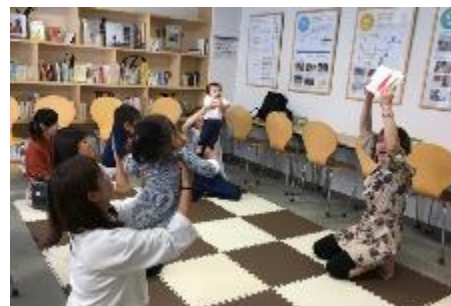
●絵本の読み聞かせイベントの様子