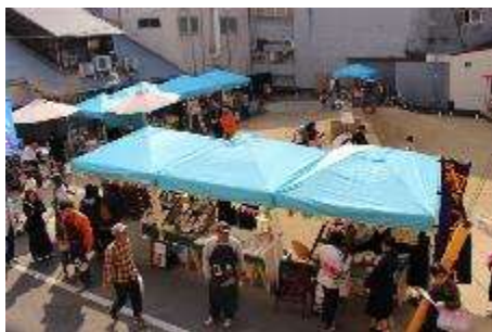
●マルシェ開催の様子

みんなのひろばでは計 83 件（月平均約 2 件）のイベントが実施され、延べ利用者数は約 22.8 万人（月平均約 4,900 人）であった。もぶるテラスでは計 865 件（月平均約 18 件）のイベントを実施し、延べ利用者数約 9.1 万人（月平均約 1,800 人）であった。開催されたイベントのうち、一般の個人・団体の開催率は、ひろばで約 4 割、テラスで約 6 割であった。中央商店街をはじめ、様々な主体と連携しながら、みんなのひろばでは、マルシェや音楽ライブ、フリーマーケット等が実施され、もぶるテラスでは、商店街を回るスタンプラリーの実施や絵本の読み聞かせ、各種ワークショップ・講座等、多様なイベントが展開された。