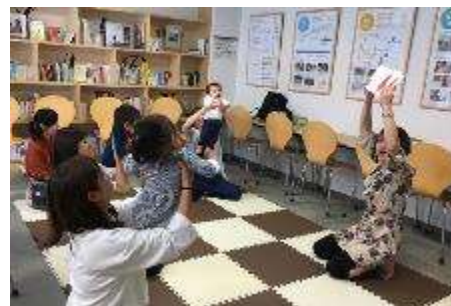
●絵本の読み聞かせイベントの様子