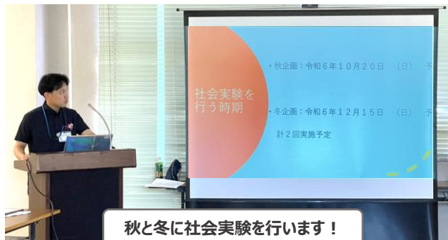
秋と冬に社会実験を行います！