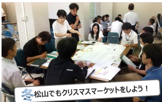
冬 松山でもクリスマスマーケットをしよう！