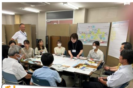
秋 市駅前にまったりできるスペースを！

冬 チーム クリスマスマーケット × 市駅前 Eats × Live! Live! Live! しえきまえ♪