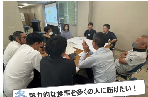
冬 魅力的な食事を多くの人に届けたい！