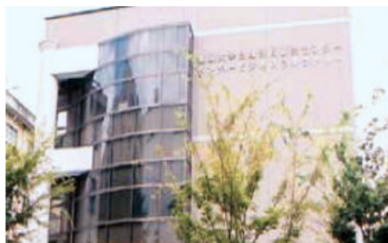
愛媛大学 ベンチャー・ビジネス・ラボラトリー