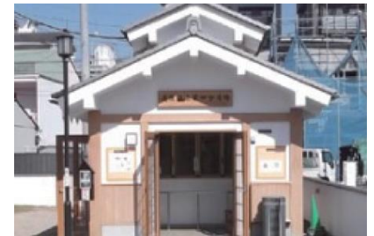
道後温泉 第4分湯場

道後温泉の特徴である複数の温度の異なる源泉をブレンドの様子を見学できる「手湯」を設けている。