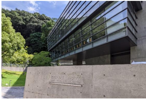
坂の上の雲ミュージアム

まちづくりの中核施設として、平成19年4月28日に開館。建築家・安藤忠雄氏が設計した。