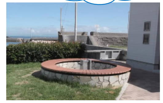
まつやま・ほりえ海の駅 うみてらす

全国で150番目に認定された海の駅。ベンチもあり、瀬戸内海や海に沈む夕日を望むことができる。