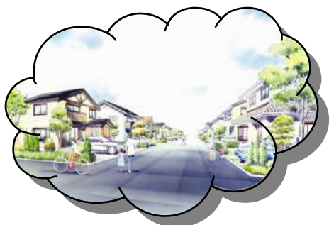
区画整理後の町並みイメージ図