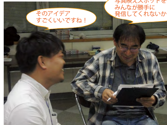
そのアイデア すごくいいですね！