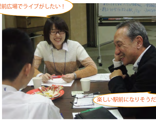
駅前広場でライブがしたい！