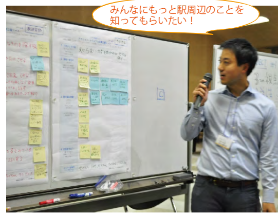
みんなにもっと駅周辺のことを 知ってもらいたい！