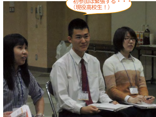
初参加は緊張する・・・ (現役高校生！)