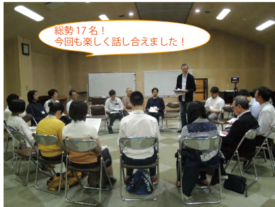
総勢 17名！ 今回も楽しく話し合いました！