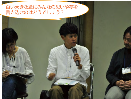
白い大きな紙にみんなの思いや夢を 書き込むのはどうでしょう？