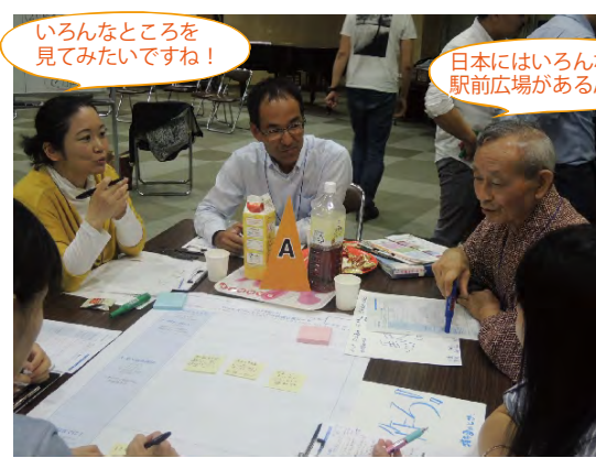
いろんなところを 見てみたいですね！