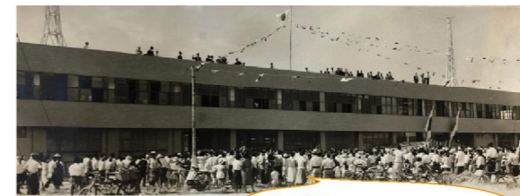
昭和2年の 開業当時の松山駅でのもちまき！！