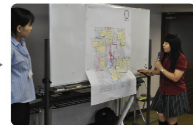
グループごとに発表