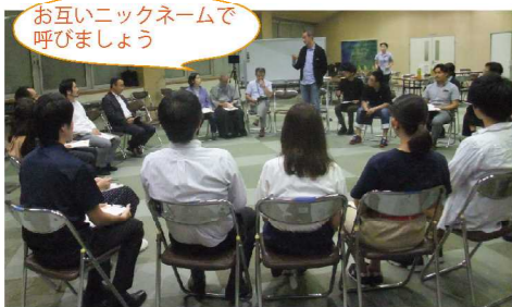
お互いニックネームで呼びましょう

久しぶりの再会、また、新しい出会いに、少し緊張のあるスタート… 自己紹介を兼ねたアイスブレイクで、緊張を解きほぐしました。