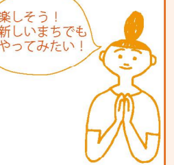
楽しそう！ 新しいまちでも やってみよう！