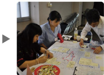
帰って「発見マップづくり」