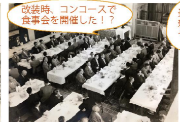
改装時、コンコースで 食事を開催した！？