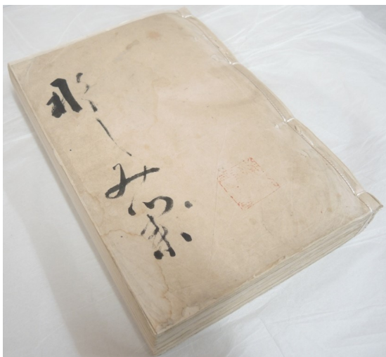
子規選句稿「なじみ集」

企業や団体の皆さんから取り組みを募集し、記念の年を共に盛り上げました。テレビ番組や新聞・雑誌等でのロゴマークの使用、市民演劇や展覧会の実施、商品の開発など、様々な記念の取り組みが生まれました。