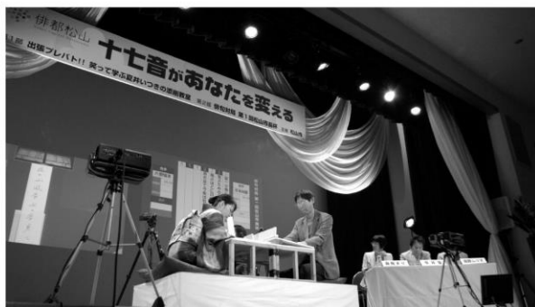
▲昨年松山市で開催された俳句対局の様相

1957年愛媛県生まれ。松山市在住。8年間の中学国語教諭の後、俳人へ転身。「第8回俳壇賞」受賞など。俳句集団「いつき組」組長。創作活動&指導に加え、俳句の授業〈句会ライブ〉、全国高等学校俳句選手権「俳句甲子園」の創設にも携わるなど幅広く活動中。テレビラジオのレギュラー出演、MBS「プレバト!!」俳句コーナー出演中。松山市公式俳句サイト「俳句ポスト365」選者、朝日新聞愛媛俳壇選者、愛媛新聞日曜版小中学生俳句欄選者。句集「伊月集 梶（マルコボコム）」、「100年俳句計画（そうえん社）」、「子規365日（朝日新書）」、「絶滅寸前季語辞典（ちくま文庫）」、「超辛口先生の赤ペン俳句教室（朝日出版社）」など著書多数。2015年5月、松山市から俳都松山大使に任命される。