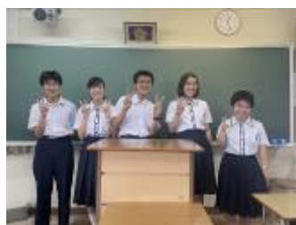
智辯学園和歌山高等学校 (和歌山県)