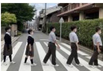
洛南高等学校 (京都府)