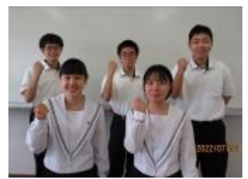
愛媛県立今治西高等学校 伯方分校(愛媛県)