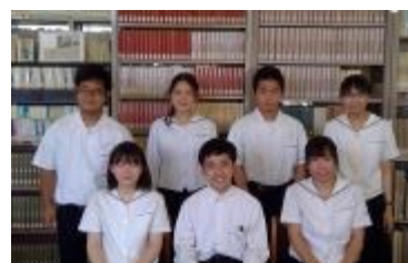
愛知県立幸田高等学校 (愛知県)