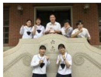
岡山県立岡山朝日高等学校 (岡山県)