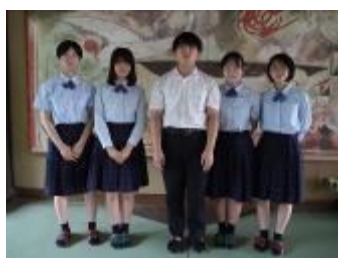
福島県立磐城高等学校 (福島県)