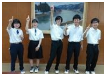
山形県立山形東高等学校 (山形県)