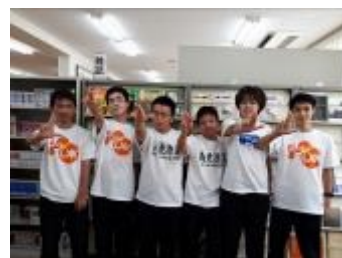
群馬県立高崎高等学校 (群馬県)