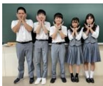
興南高等学校A (沖縄県)