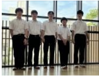
海城高等学校B (東京都)