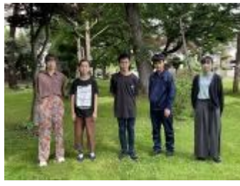
北海道旭川東高等学校 (北海道)