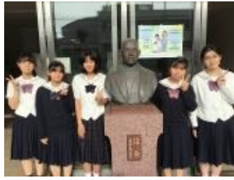
桜花学園高等学校 (愛知県)