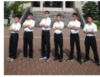
名古屋高等学校A (愛知県)