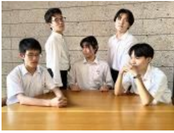
海城高等学校A (東京都)