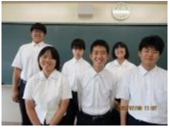
愛知県立豊橋西高等学校 (愛知県)