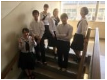
山口県立徳山高等学校A (山口県)