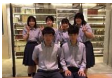
鶯谷高等学校 (岐阜県)