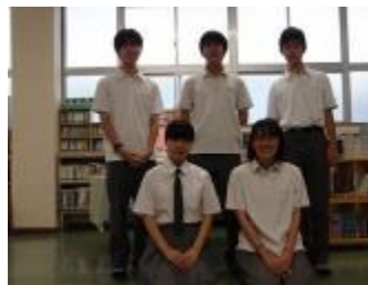
石川県立金沢泉丘高等学校 (石川県)