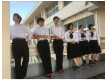
山口県立徳山高等学校B (山口県)