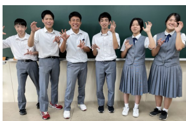
興南高等学校B (沖縄県)