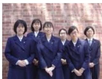
栃木県立宇都宮中央女子・ 中央高等学校 (栃木県)