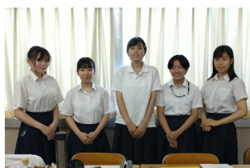
神奈川県立横浜翠嵐高等学校 (神奈川県)