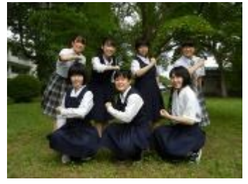
岩手県立水沢高等学校 (岩手県)