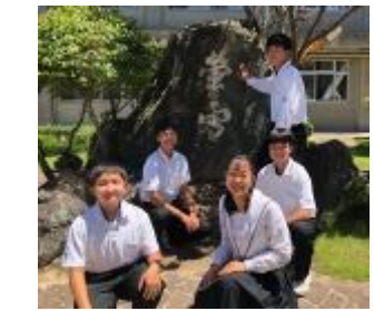
愛媛県立今治西高等学校 (愛媛県)