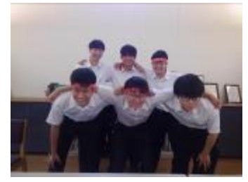
名古屋高等学校B (愛知県)