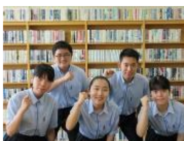
新田青雲中等教育学校 (愛媛県)