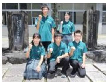
愛媛県立松山東高等学校 (愛媛県)