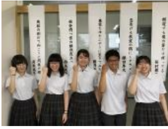
旭川実業高等学校 (北海道)