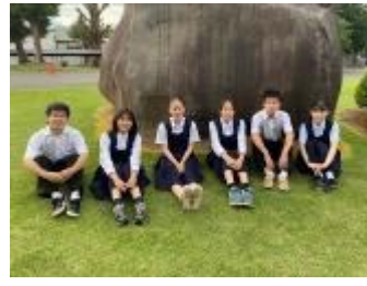
青森県立弘前高等学校 (青森県)