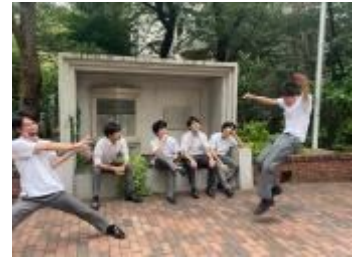
立教池袋高等学校 (東京都)