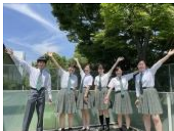
慶應義塾湘南藤沢高等部 (神奈川県)