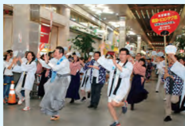
平澤市長らが松山まつりで市民と交流