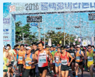
毎年10月に開催の平澤港マラソン大会