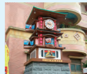
松山小学校前にある「幸福からくり時計」