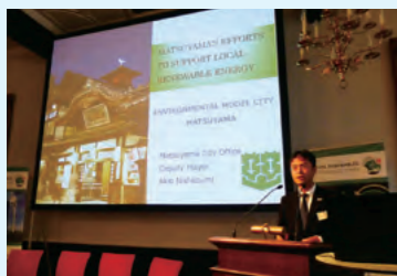
フライブルク市の環境会議で松山市の環境施策を講演

平成28年に姉妹都市提携35周年を迎え、サクラメント市訪問団が本市を訪問し、みんなの生活展に参加するとともに、両市小学校の姉妹校提携調印式やアーモンドの記念植樹、興居島でのみかん収穫体験を行うなど、交流を深めています。