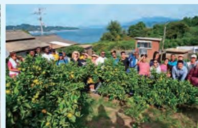
興居島でみかんの収穫体験