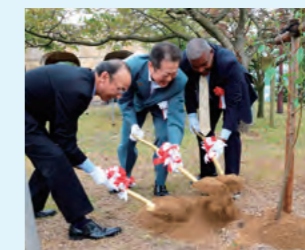
アーモンドの記念植樹