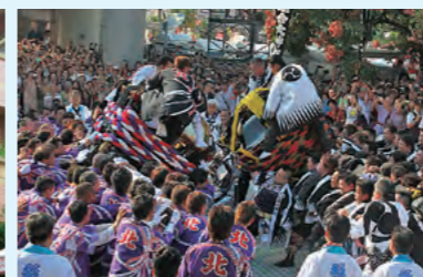
台北市で披露された鉢合わせ