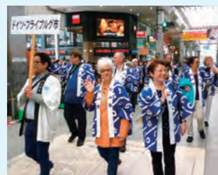
松山春まつりに参加し、市民と交流