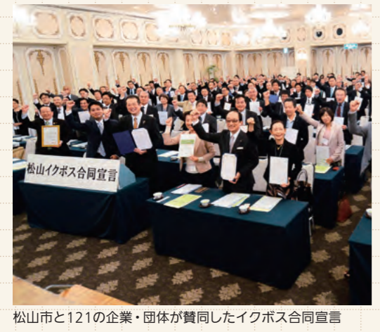
松山市と121の企業・団体が賛同したイクボス合同宣言