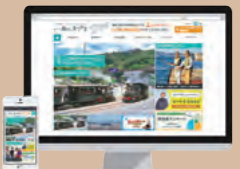
移住定住ウェブサイト「いい暮らし。まつやま」

まちの魅力や生活基盤など、移住を検討する上で必要な情報をまとめたWebサイトを開設しています。