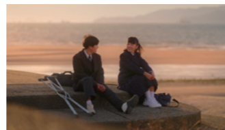
地域プロモーションアワード2025 ふるさと動画大賞 受賞

ブランドスローガンを多くの人に知ってもらうため、市内で動画を撮影し発信しています。市民の皆さんが出演しています。