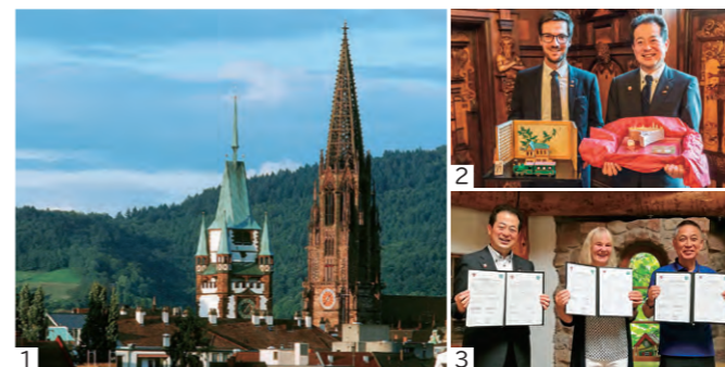
1. フライブルク市のシンボルマルティン門とミュンスタ / 2. フライブルク市役所での歓迎式典 / 3. エコフレンドシップ協定を再締結

フライブルク市は、13世紀初頭から3世紀を要して建てられたミュンスタ（大聖堂）などの歴史的な文化遺産が多く残り、中世の雰囲気にも包まれたまちです。環境重視のまちづくりを進めていることから「エコポリス（環境都市）」とも呼ばれており、両市の環境会議に相互に出席するなど、交流を深めています。令和元年には、姉妹都市提携30周年を記念して、記念訪問団がフライブルク市を訪問し、歓迎式典への出席やエコフレンドシップ協定の再締結を行いました。