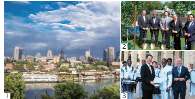
1. 州都として発展するサクラメント市 / 2. 姉妹校での記念植樹 / 3. ダレル・スタインバーグ市長と姉妹校の生徒による歓迎

平成28年に姉妹都市提携35周年を迎え、平成29年には記念訪問団がサクラメント市を訪問しました。松山市のPRのほか、姉妹校提携調印式への出席や記念植樹を行うなど交流を深めています。