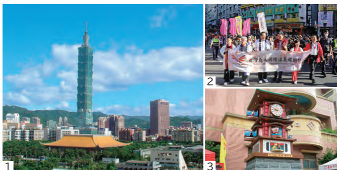
1. 台北市街と「台北101」 / 2. 台北市でのパレードの様子 / 3. 松山国民小学校前にある「松山・道後温泉幸福からくり時計」

漢字で同じ「松山」という地名や、共に最古といわれる温泉があることを縁として交流を開始し、観光・文化・スポーツなど幅広い分野で交流を進めてきました。令和5年には友好交流協定締結10周年記念の幕開けとして、台北市で道後神輿の鉢合わせを披露したほか、パレードを行いました。