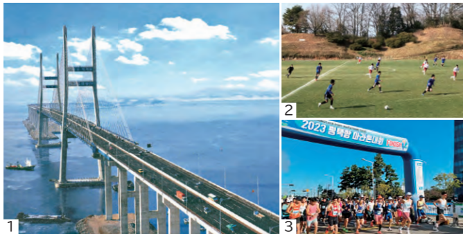
1. 平澤港へとつながる「西海大橋」 / 2. 平澤FC U-18とのサッカー交流 / 3. 毎年秋に開催の平澤港マラソン大会

両市で開催されるマラソン大会への参加や、サッカー交流など、スポーツや青少年の交流を行っています。