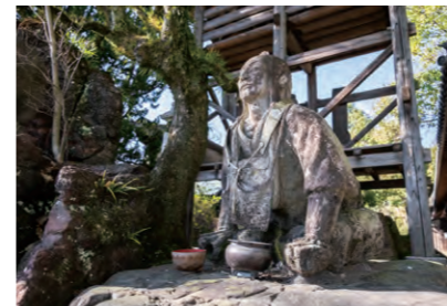
松山市は四国の市町村で、最も多くの札所が集中。観光地にも近く、温泉や穏やかな風景が多くのお遍路さんを癒してきた(石手寺)