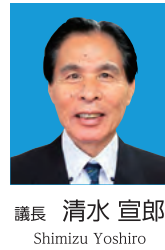
議長 清水 宣郎 Shimizu Yoshiro