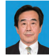
副市長 梅岡 伸一郎 Umeoka Shinichiro