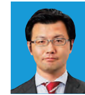
副市長 北澤 剛 Kitazawa Tsuyoshi