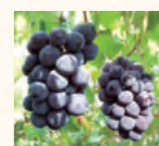
伊台・五明こうげんぶどう