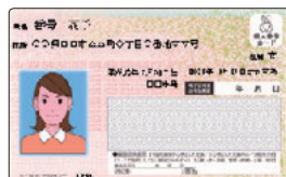
※紙製の通知カードは利用できません