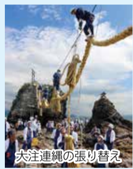
大注連縄の張り替え

北条鹿島まつりが開催されます。「鹿島権練り」では、権伝馬船二隻と御船二隻が航走し、小学生がボンデンを掲げて踊り、青年が剣に見立てた権を振って伝統の舞を披露します。地元の消防団による大注連縄の張り替えでは、大注連縄に編み込む「願い文」を、JR伊予北条駅・鹿島渡船待合所・鹿島観光情報センターの願い文ポストに投函できるほか、5月4日8時30分から10時まで鹿島神社鳥居前で受け付けます。