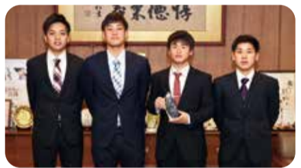
TEAM EHIME 3月12日受賞