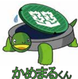
松山市下水道 イメージキャラクター

市や公営企業局が、特定の業者に宅内排水設備の点検・洗浄を依頼することはありません。注意してください。