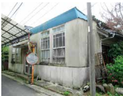
改修予定の中島の建築物

令和5年度に、松山市美しい街並みと賑わい創出事業補助金（クラウドファンディング活用型）に申請のあった事業が認定を受け、クラウドファンディングを実施しています。