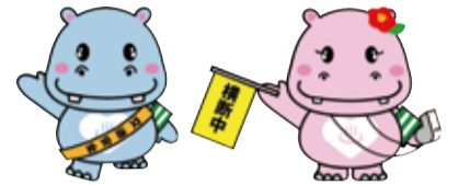
市交通安全マスコット カバッキー&カパリン