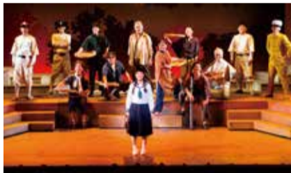
坊っちゃん劇場ミュージカル