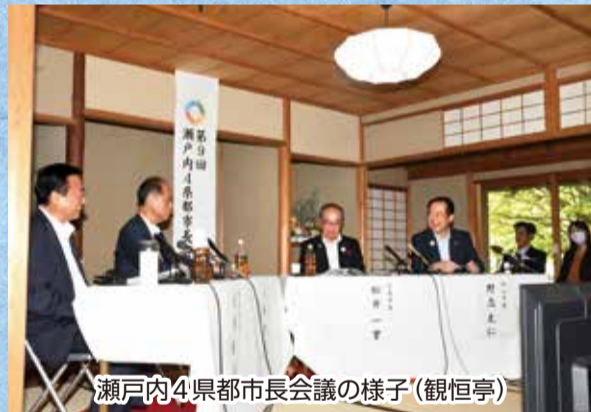
瀬戸内4県都市長会議の様子(観恒亭)