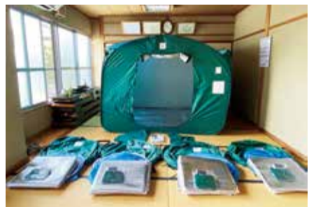
整備された資機材の一部(写真は間仕切り)