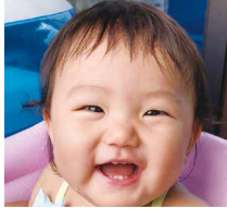
ひなた 日向ちゃん (善応寺) 10月15日生まれ