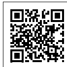
水産市場 ホームページ