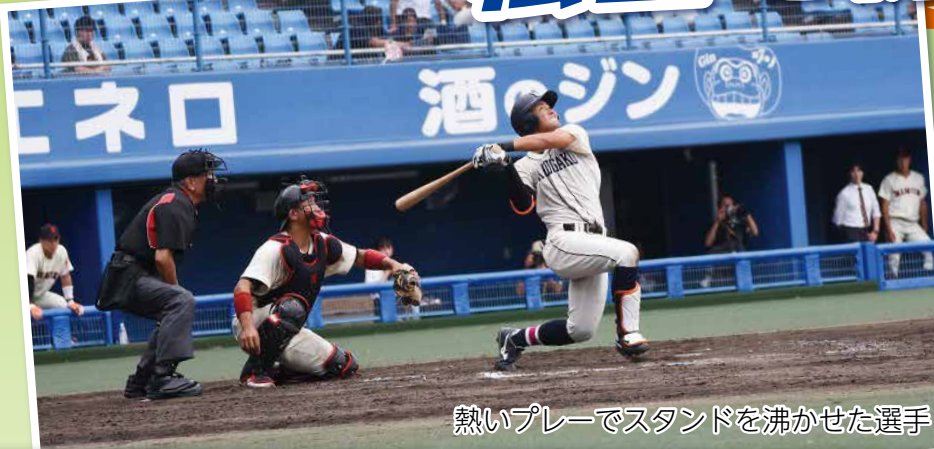
熱いプレーでスタンドを沸かせた選手