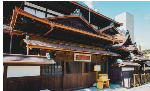
道後温泉の活性化に活用

株式会社トップシステムから、7月31日に「道後温泉活性化事業」に企業版ふるさと納税制度で、多額の寄付を頂きました。新しい道後ブランドを創り出し、道後温泉の活性化と持続可能なまちづくりに活用します。