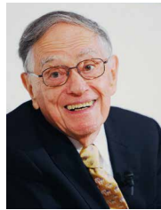
ドナルド・キーン