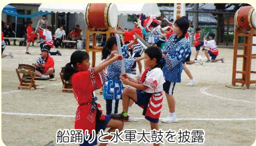
船踊りと水軍太鼓を披露