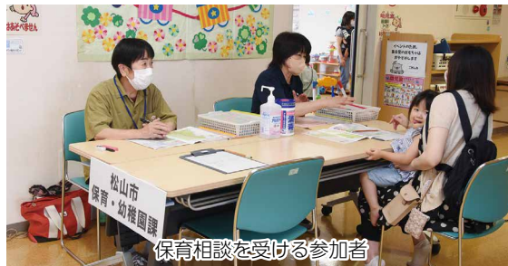
保育相談を受ける参加者

また、子育て情報の紹介や保育相談もあり、入園を控えた人が訪れるなど、会場は多くの親子連れでにぎわいました。