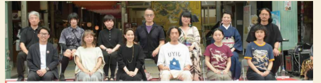
DOGO ART 2023 クラフトミュージアム 2023.7.14 - 2024.2.29

道後温泉では「アート&クラフト」をテーマに、4月14日から「道後アート2023」を開催中。7月14日にプログラムの一つである「クラフトミュージアム」が開幕しました。道後のまちを散策し、歴史ある道後温泉の風情と現代アートの魅力を味わいながら、工芸の最先端に触れられます。