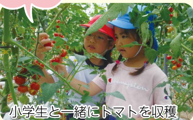
小学生と一緒にトマトを収穫