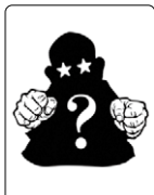
どんなカードかお楽しみに