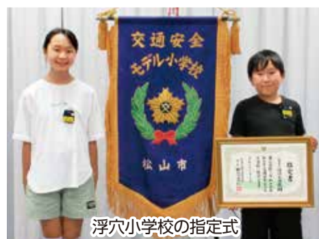
浮穴小学校の指定式

松山市と松山市交通安全推進協議会は、交通事故を防止し、交通安全の意識を高めるため、毎年、モデル園とモデル小学校を指定しています。今年度は浮穴小学校と認定こども園さくら幼稚園で指定式を開催。代表の児童や園児が、交