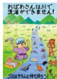
令和4年最優秀作品 (小学生の部)