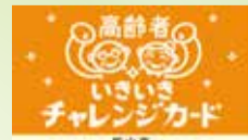
(チャレンジカード見本)