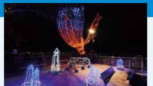
昨年の光のオブジェ

松山観光・国際交流課 ☎948-6557・FAX943-9001 松山城総合事務所 ☎921-4873