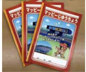
松山市&愛媛マンダリンパイレーツオリジナル自由帳