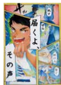
令和4年最優秀作品 (ポスター・中学生の部)

申問 9月8日(金)まで。直接、在籍校または市選挙管理委員会事務局 (市役所第四別館2階) ☎948-6622・FAX934-1811へ