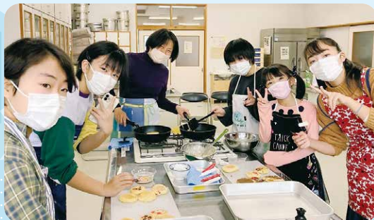
中島でお菓子作り交流会を開催

令和4年4月から活動し、2年目を迎えました。島内の飲食店での調理研修や地域の活動に積極的に参加し、島のことを教わりながら、有意義な日々を過ごしています。 これまで国内外を食べ歩いた経験や調理師免許・野菜ソムリエなどの資格を生かして、飲食店開業を目指しています。今後も、お菓子作りなど食を通じたイベント交流会を定期的に開催したいです。