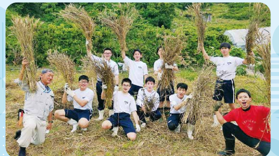
中島の学生と小麦を収穫

令和3年4月から活動し、3年目を迎えました。できる限り地域の生活を観察し、地域住民の声に耳を傾けながら「地域の役に立てることは何か」を常に考え、行動してきました。 高齢化で管理が不十分な施設や空き家などが増え、維持管理作業の支援が必要になっています。隊員としての最後の1年、社会奉仕活動とともに、これまで以上にチャレンジしていきたいです。