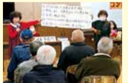
寸劇後に注意事項を説明

ファクス・eメールで申込書(市民生活課〈市役所本館1階〉、市ホームページ)に団体・担当者名、電話番号、希望日時、開催場所、参加人数、希望テーマを書いて、〒790-8571 市民生活課 shouhi@city.matsuyama.ehime.jpへ