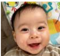
中神 凧塔ちゃん (北井門二丁目) 5月11日生まれ