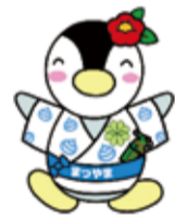
松山市民生児童委員協議会マスコット「松山市版ミンジー」