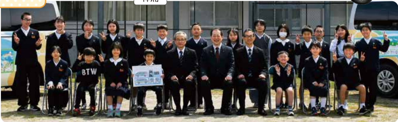
図(教)学校教育課 ☎(089)948-6591 ・ ☎934-1815