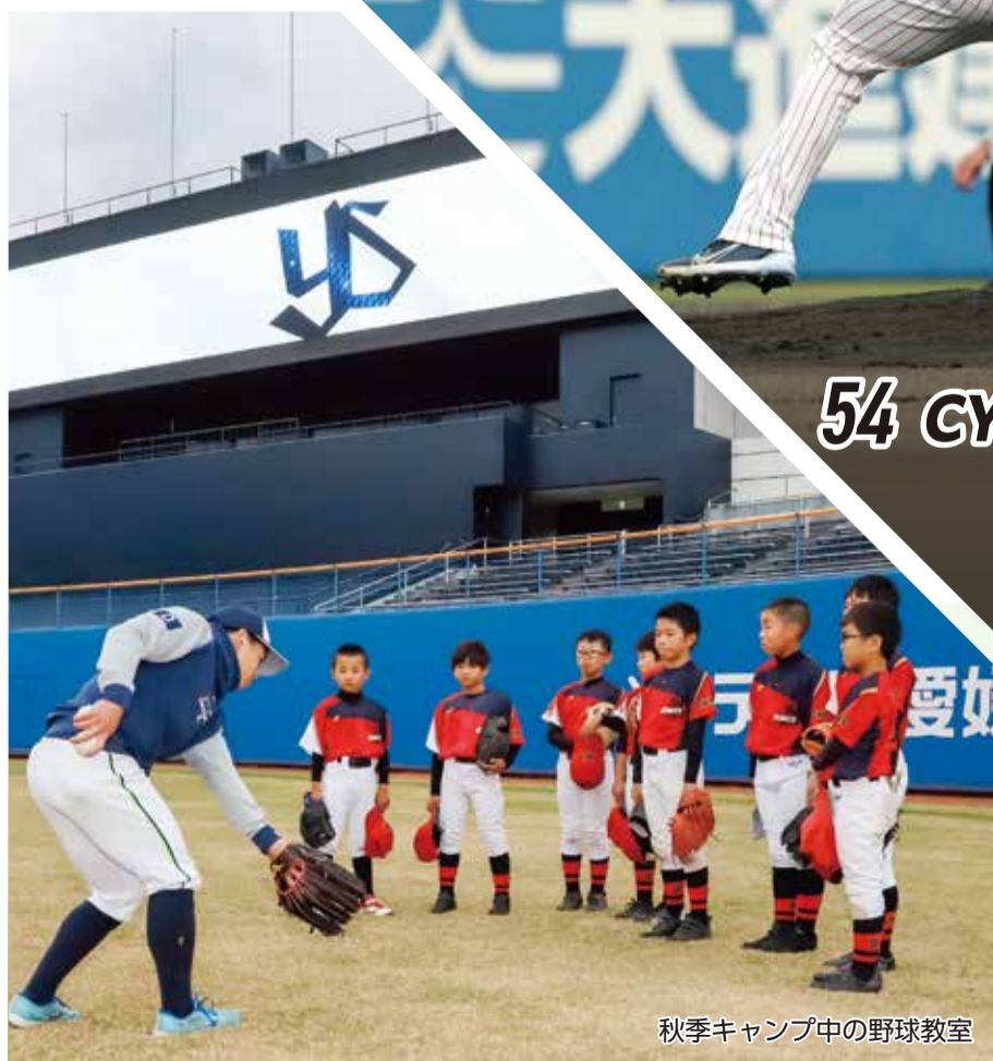
秋季キャンプ中の野球教室