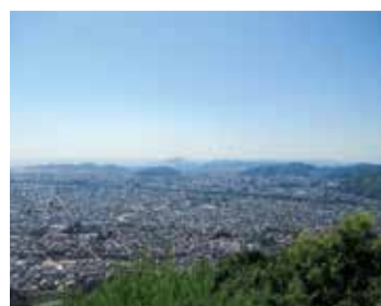
きらめき奨励賞(まちなみ・まちづくり部門) 「淡路ヶ峠」