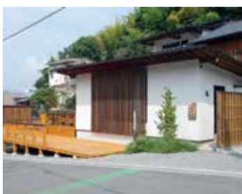
きらめき大賞 「伊月庵」