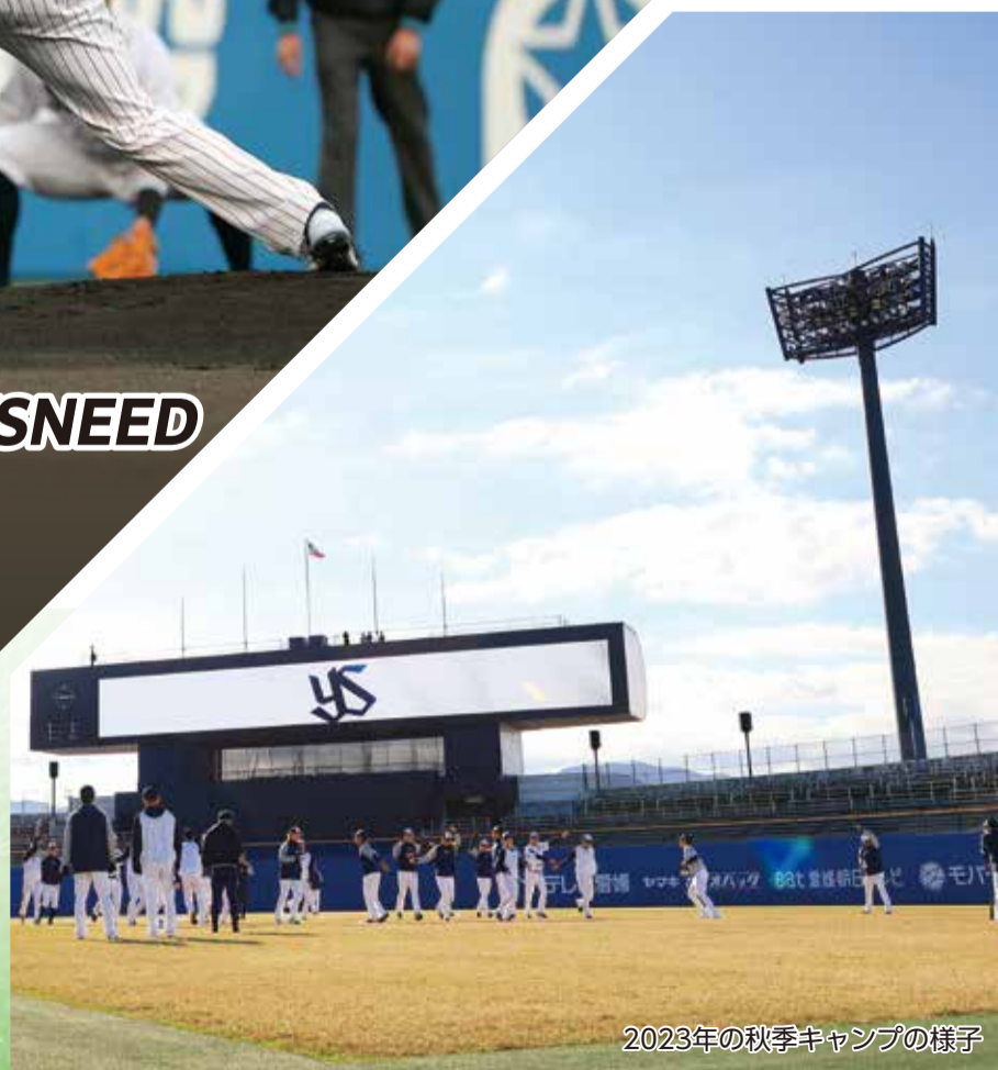
2023年の秋季キャンプの様子