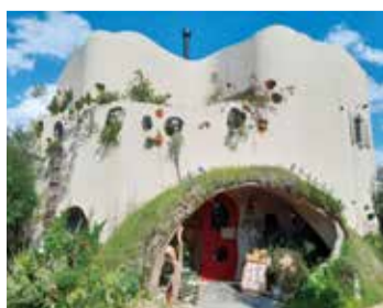
きらめき奨励賞(建築部門) 「ぱんや雲珠」