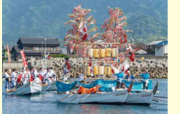
鹿島の権練りの様子

伊予の豪族・河野氏の武勇を継承する北条鹿島まつりを開催します。ぜひ、お越しください。