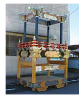
片町区の祭り用具

(一財)自治総合センターの宝くじ受託事業収入を財源としたコミュニティ助成事業で、次の地域で地域コミュニティのための備品を整備しました。▶片町区＝祭り用具(屋台・太鼓<修繕>、御幕)▶鹿峰町内会＝祭り用具(神輿<修繕>)▶福音寺町内会＝放送設備(アンプ、スピーカー、鋼管柱など)▶歩行町一丁目町内会＝祭り用具(大人神輿) 日 まちづくり推進課 ☎(089)948-6330・FAX934-1821