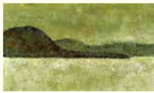
古茂田守介(声ノ湖)1960年、町立久万美術館蔵