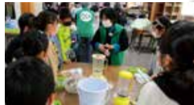
リサイクルの講座など体験型学習