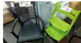
粗大ごみとして捨てられたものを修理して販売