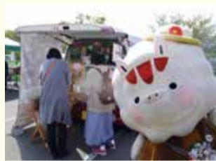
ほっちょ市の様子