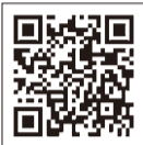
リっくるインスタ