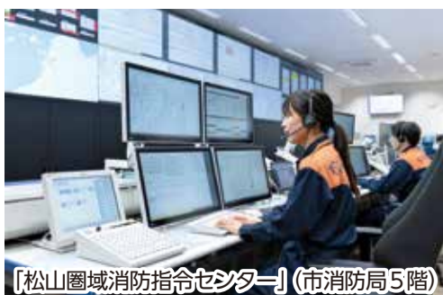
【松山圏域消防指令センター】(市消防局5階)

四国地方最大で県内初の共同指令センターで、複雑で多様化する災害に広域で対応し、消防隊や救急隊がさらに速く出動できます。