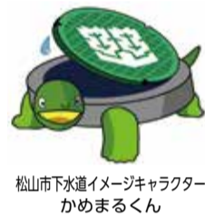
松山市下水道イメージキャラクターかめまるくん

4月から井戸水や簡易(専用)水道を利用・やめる場合の届け出先がヴェオリア・ジェネッツ(株)に変わります。 4月1日~ 対井戸水や簡易(専用)水道を利用し、下水道を使用している人 内井戸水や簡易(専用)水道を使い始める・やめる▶転入、転出、出生などで使用人数が変わる▶使用目的(営業用・個人用)が変わる ※下水道使用料が変わりますので、必ず届け出てください 会ヴェオリア・ジェネッツ(株)☎(松山)(089)915-0311・(北条)(089)911-7731