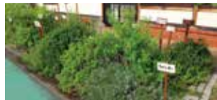
姉妹都市フライブルク(ドイツ)との友好の証