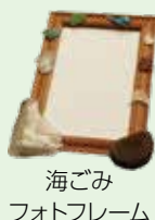
海ごみ フォトフレーム