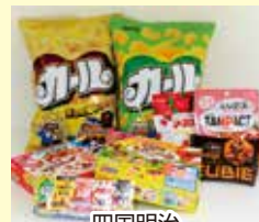
四国明治 お菓子詰め合わせ