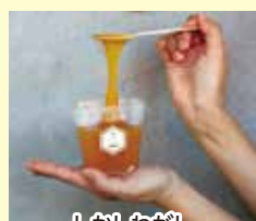
しかしわがし 商品引き換え券1,000円分