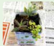
多肉植物アレンジメント