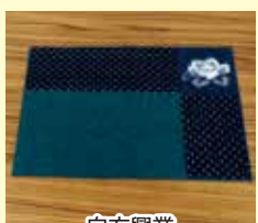
白方興業 伊予かすりランチョンマット

圏シティプロモーション推進課 ☎(089) 948-6877 FAX 934-2578