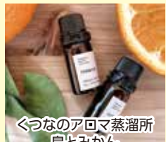
くつなのアロマ蒸溜所 島とみかん エッセシャル アロマオイル5ml