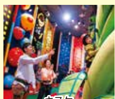
キスケ 施設利用券2,500円分