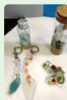
【松山北高校】 シーグラス 小物販売