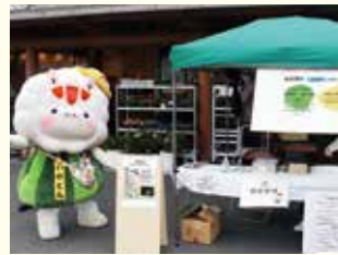
イメージキャラクターいのとん

日時 1月21日(日) 10～15時 (売り切れ次第終了) 会場 東温市さくらの湯観光物産センター (東温市北方) 問 (一社) 東温市観光物産協会 ☎(089) 993-8054