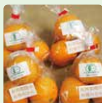
【愛媛大学附属高校】 有機栽培みかんなど 青果販売