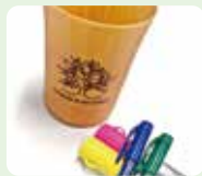
タンブラーお絵かき教室