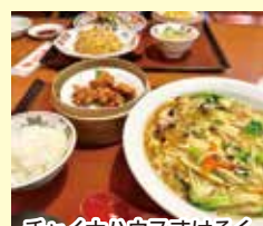
チャイナハウスすけろく お食事券4,000円分