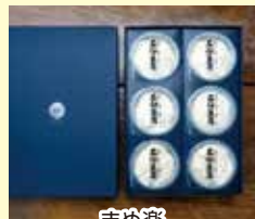
まめ楽 石臼豆腐ギフト